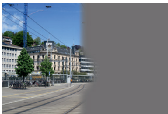
Abb. 4: Hemianopsie nach rechts