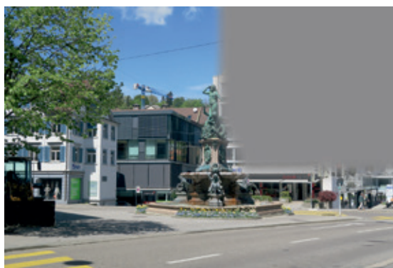
Abb. 6: Quadrantenanopsie nach rechts oben