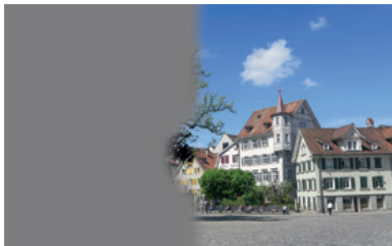
Abb. 3: Hemianopsie nach links

Gesichtsfeldausfälle sind bei neurologischen Patienten alles andere als selten! In der Analyse von 656 Pa-