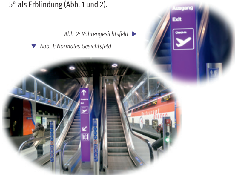
▼ Abb. 1: Normales Gesichtsfeld