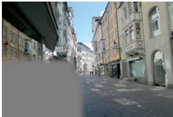
Abb. 5: Quadrantenanopsie nach links unten