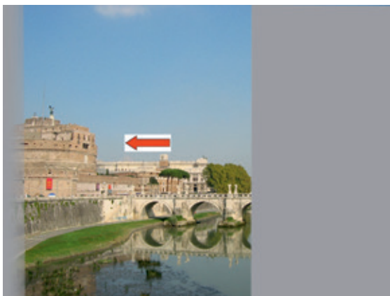
Abb. 9: Hemianopsie links Blicksakkade 2

Das Kompensationstraining verbessert nicht das Gesichtsfeld. Vielmehr erlernt der Hemianopsie-Patient einen sinnvollen Umgang mit seiner Sehstörung. Die visuelle Alltagskompetenz verbessert sich durch das Training nachweisbar (Roth et al. 2009).