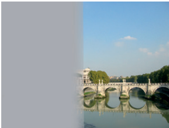
Abb. 7: Hemianopsie nach links