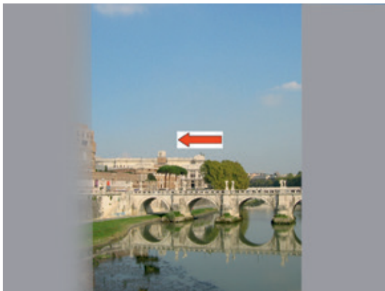
Abb. 8: Hemianopsie links Blicksakkade 1